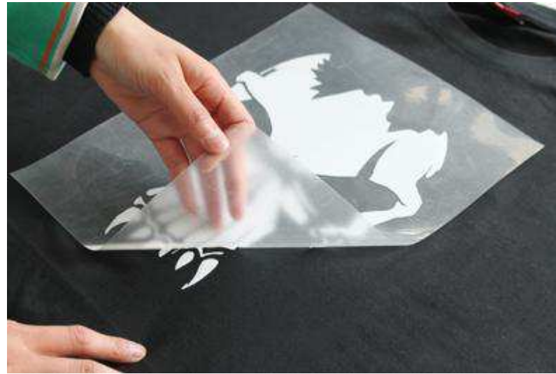
9) Décollez à froid le papier de base.