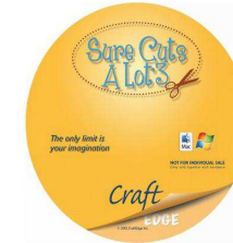
Sure Cuts A Lot V3