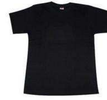
2 T-shirts de couleur foncée (002086)