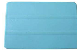
1 grattoir carré en vinyle