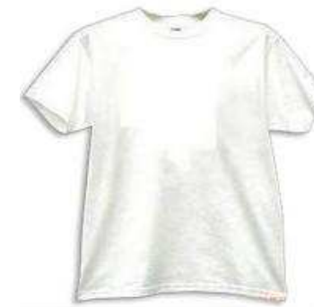
2 T-shirts de couleur claire (002087)