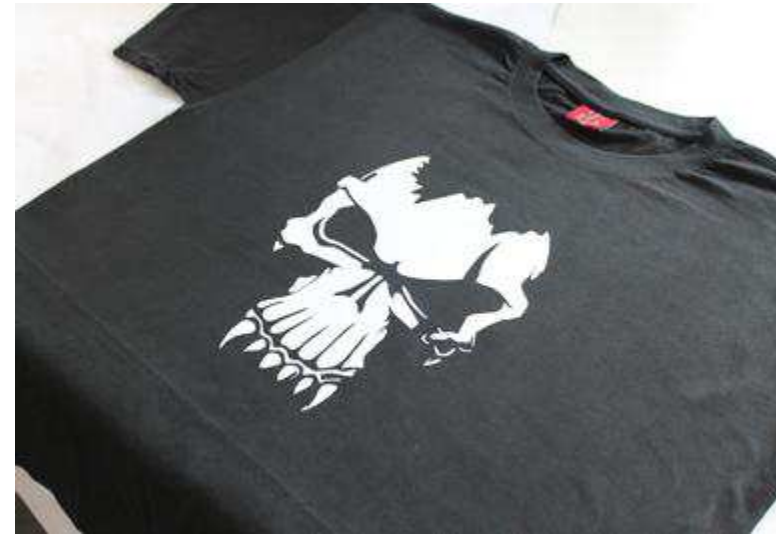
10) Un design recherché sera complètement sur votre T-sh unique.